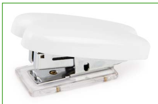
FAR037 Grapadora Muelita