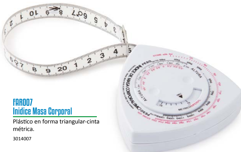
FAR007 Índice Masa Corporal

Plástico en forma triangular-cinta métrica. 3014007