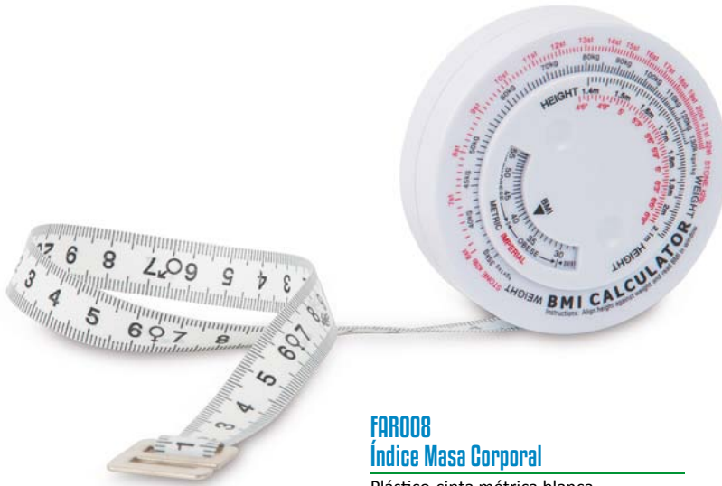
FAR008 Índice Masa Corporal