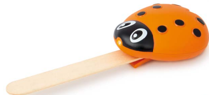
FAR005 Baja Lengua Mariquita

Plástico. Con luz; opera con baterías. 3014005 Naranja