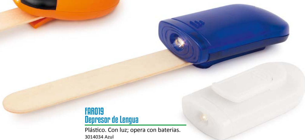
FAR019 Depresor de Lengua

Plástico. Con luz; opera con baterías. 3014005 Naranja