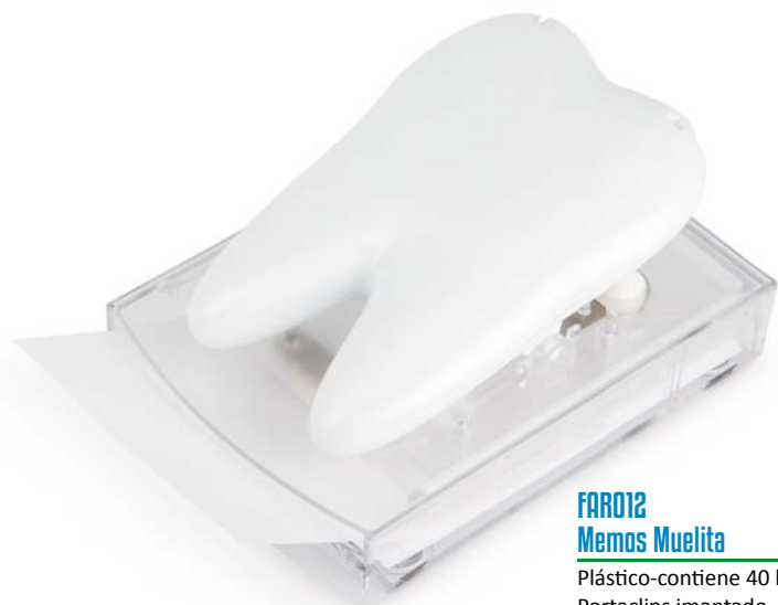
FAR012 Memos Muelita

Plástico-contiene 40 hojas de papel. Portaclips imantado. 3014012 Blanco